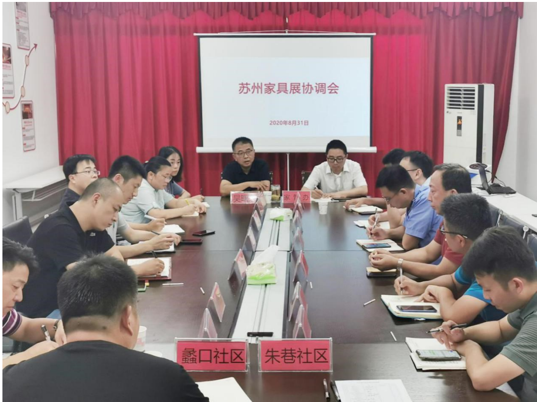
▲ 蠡口家具城管委会组织元和街道相关部门部署、安排展期相关工作，确保苏州家具展分会场——蠡口家具市场在展会期间安全、有序、顺利举办