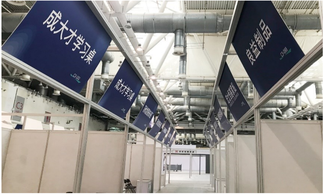
▲开展前搭建效果图