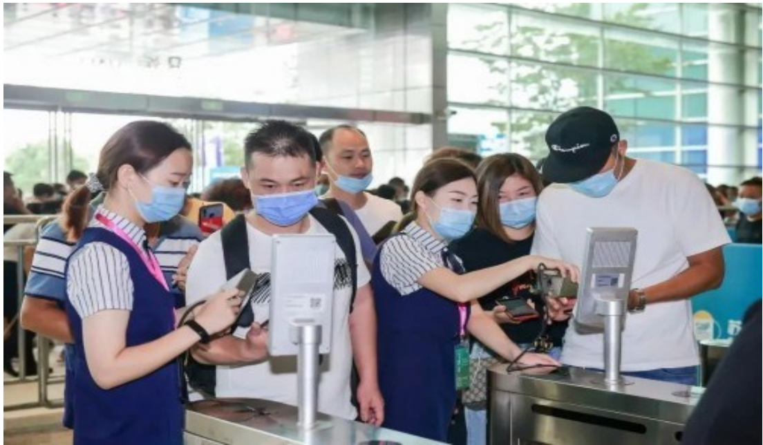
▲ 200位工作人员严阵以待、耐心服务