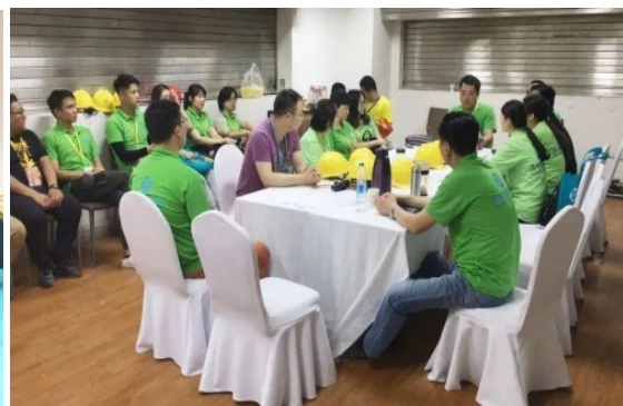
▲ 向自己说一声辛苦了