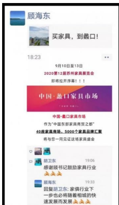
▲ 相城区委书记顾海东先生为蠡口家具产业和苏州家具展发声