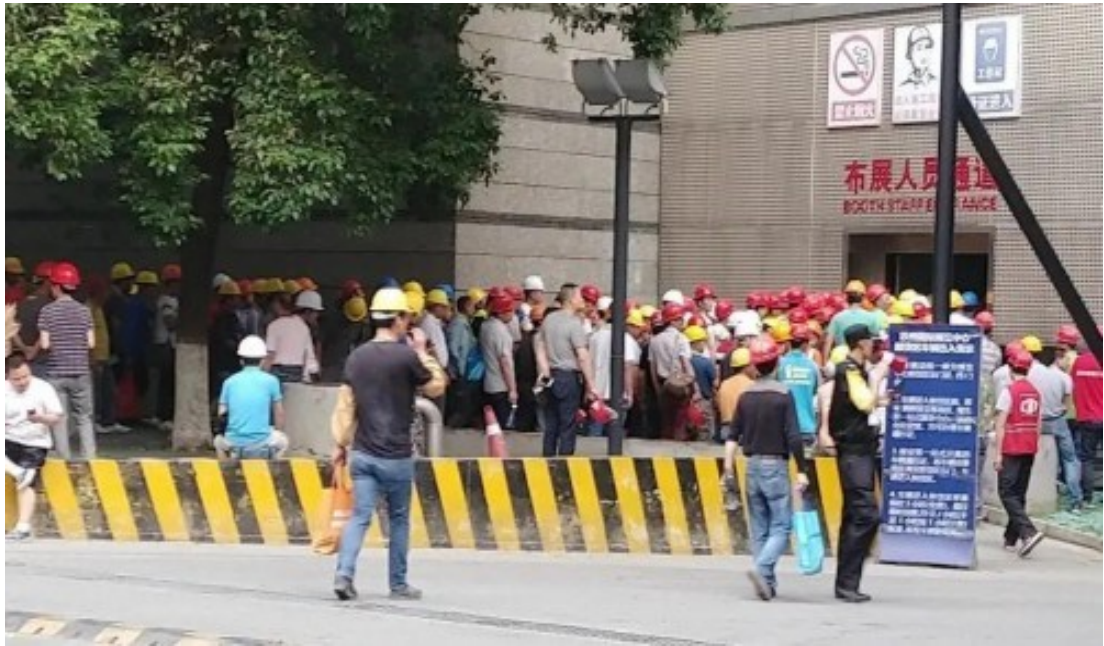
▲ 统一搭建安全施工

本届展会严格落实政府及场馆方防疫工作要求，6大举措安全办展：核查身份、实名登记、全员体温、佩戴口罩、严格消毒、应急处置，确保展会安全有序进行，保障全体参会客商安全。